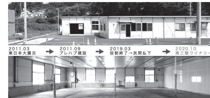
BEFORE：役目を終えた水産加工場 ※2