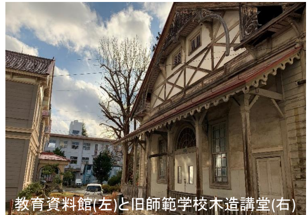
教育資料館(左)と旧師範学校木造講堂(右)

1月28日(土) 13:30~16:00 場所：県立図書館遊学館3階 第2研修室